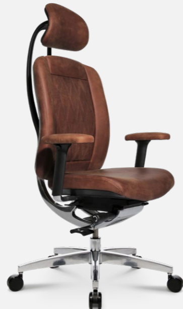
AluMedic Limited S