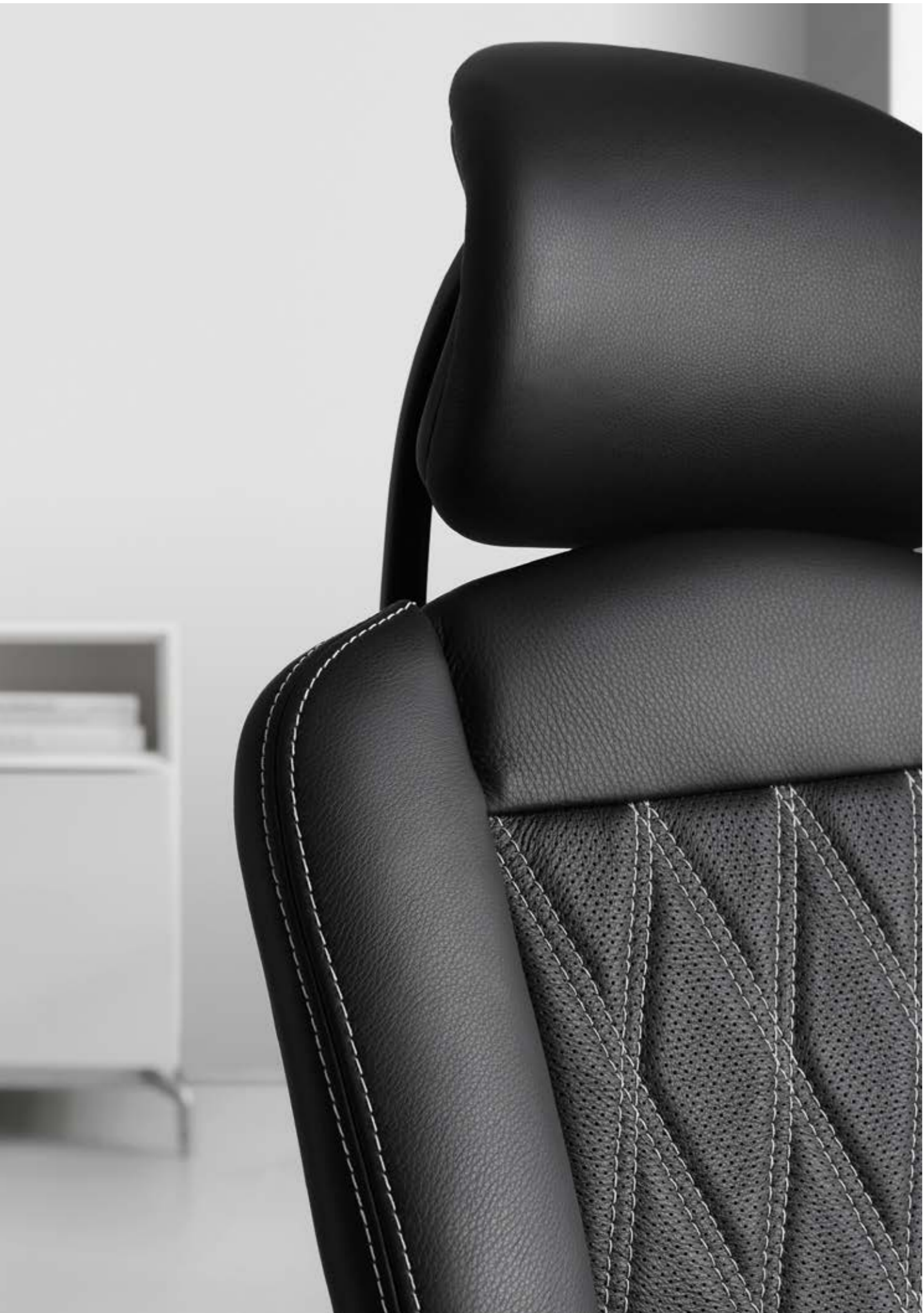
Wagner-Feeling pur in traditioneller Handarbeit! Die Liebe zum Detail verleiht unseren Sitzmöbeln einen ganz besonderen Wert. Wagner-Feeling 100% traditional hand made. The love for details gives our furniture the special touch.