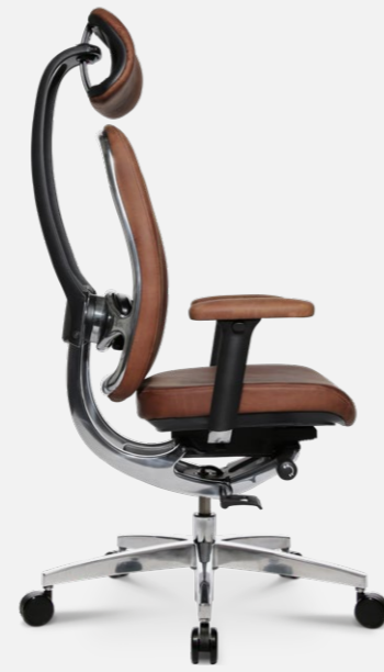
AluMedic Limited S