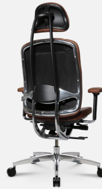
AluMedic Limited S Comfort

AluMedic Ltd. Bei dem AluMedic Limited in High Performance Ausstattung werden ausschließlich hochwertigste Materialien verwendet: Handpoliertes Aluminium, feinstes Leder auf Sitz und Kopfstütze sowie Armlehnen.