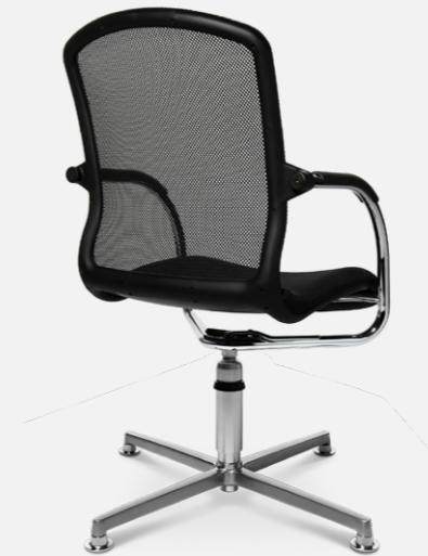
AluMedic 50 3D-Visit