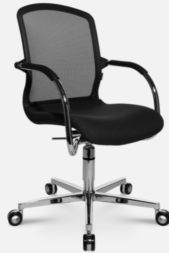
AluMedic 50 3D-Visit