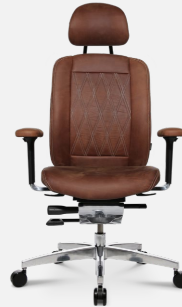
AluMedic Limited S Comfort